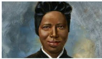
Sainte Joséphine Bakhita, une source d'inspiration ...