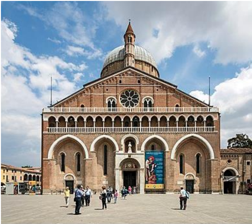
Basilique Saint-Antoine de Padoue

Vendredi 1er juillet au Lundi 4 juillet 2022