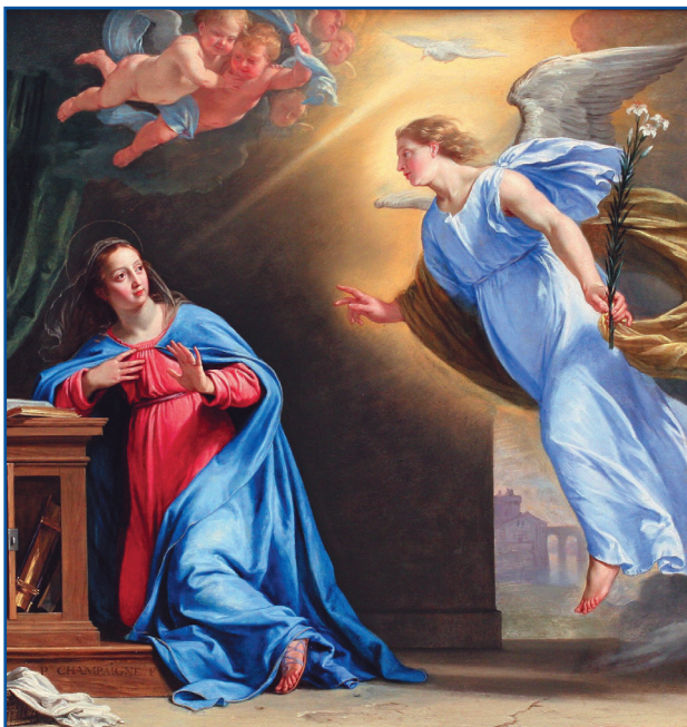
L'Annonciation , Philippe de Champaigne, 1644.