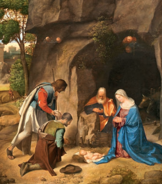
L'adoration des bergers, par Giorgione (1478-1510)

se rendirent à Bethléem, leur ville d'origine, et pendant leur séjour, les jours de l'accouchement furent accomplis pour Marie. Son épouse accouche et dans le chaos et la confusion de ces jours-là, avec la douleur au cœur, il ne trouve pour elle aucun endroit adapté à sa condition. Un seul refuge, une grotte, une caverne peut-être, servant d'abri aux animaux et aux bergers. Dans cette grotte, qui devient une grotte sainte, le Fils de Dieu est né. Il n'y a ni temps ni espace... et maintenant nous sommes devant cette grotte sacrée... avec l'Enfant Jésus. Nous qui connaissons l'histoire, que ressentons-nous dans nos cœurs pour ce divin Enfant? Pour sa sainte Mère? Pour son saint père?