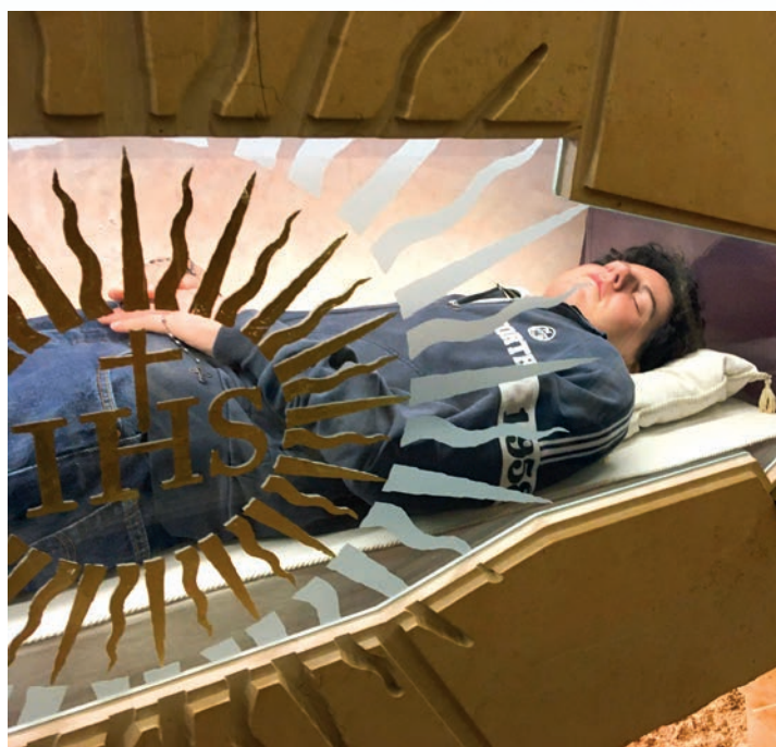
La châsse contenant la dépouille de Carlo Acutis dans l'église Santa Maria Maggiore d'Assise durant la béatification.

l'Eucharistie a fondé et entretenu sa relation avec Dieu. Il a souvent dit: «L'Eucharistie est mon autoroute vers le ciel». Chaque jour, il participait à la sainte messe et resta longtemps en adoration devant le Saint-Sacrement. Carlo avait l'habitude de dire: «Vous allez directement au ciel si vous vous approchez de l'Eucharistie tous les jours!» Jésus était pour lui un ami, un enseignant et un sauveur. Il était la force de sa vie et le but de tout ce qu'il faisait. Pour aimer son prochain et lui faire du bien, il est nécessaire de puiser l'énergie du Seigneur. Dans cet esprit, Carlo était très dévoué à Notre-Dame.