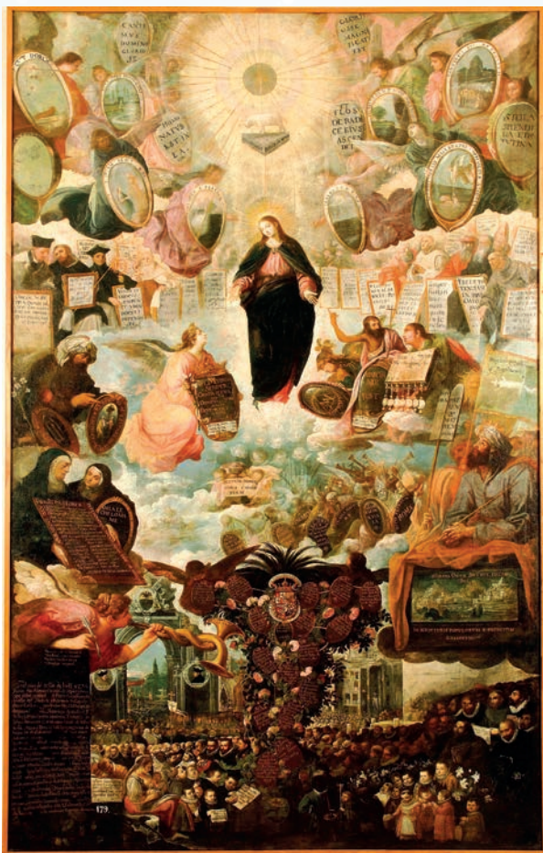
Allegorie de l'Immaculée Conception, peinture de Juan de Roelas (vers 1570-1625)

A la lecture des textes de ce jour (Gn 3,9-15.20, Ps 97, Eph 1,3-6.11-12, Lc 1,26-38), nous découvrons que chacun met en évidence un trait se rapportant à la Conception Immaculée de Marie.