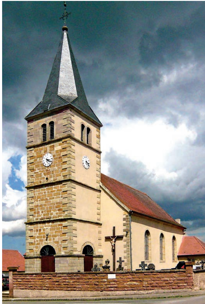
L'église de Biding aujourd'hui

En 1875 Marie demande à sa servante de fonder un couvent qui porterait le titre de l'Immaculée Conception. La Règle, dictée par la Sainte Vierge, est rigoureuse. En 1898 Mgr Fleck offre à Catherine de reconnaître sa communauté, sous la dépendance du Général