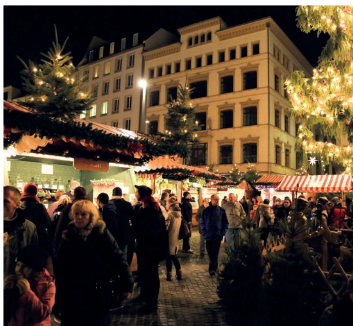
Marché de Noël à Leipzig.

Les temps sont à leur apogée. Viennent des jours où tout genou fléchira devant moi, l'esprit du mal domine mais bien-